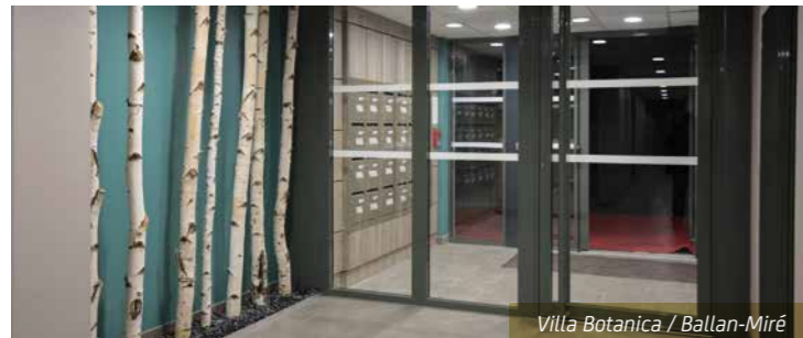
Villa Botanica / Ballan-Miré