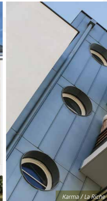
Karma / La Riche