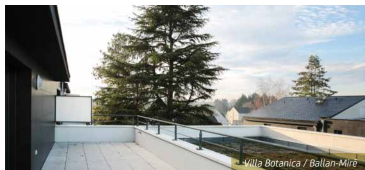
Villa Botanica / Ballan-Miré