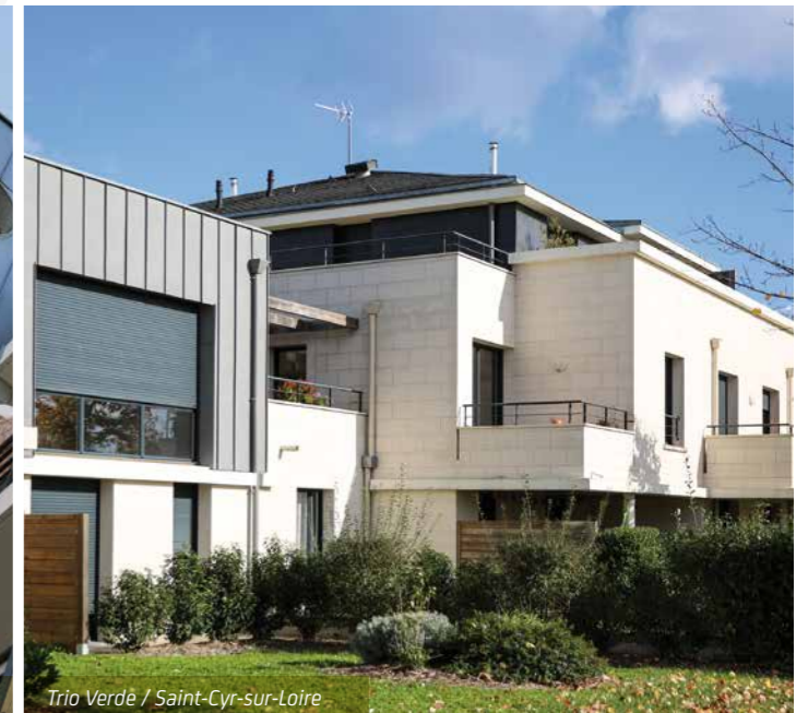
Trio Verde / Saint-Cyr-sur-Loire