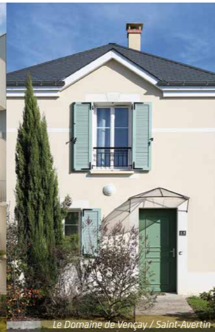
Le Domaine de Vençay / Saint-Avertin