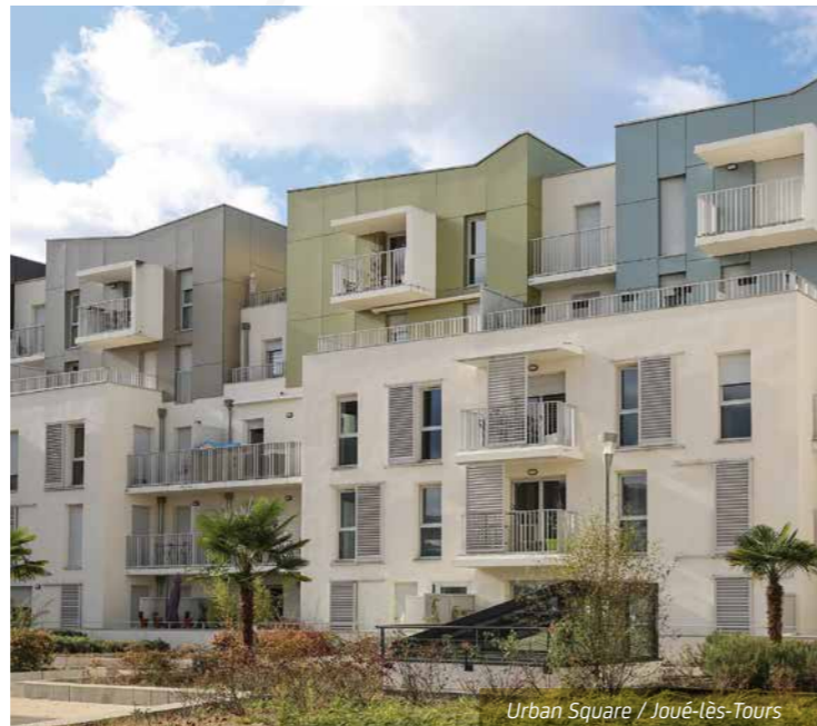
Urban Square / Joué-lès-Tours